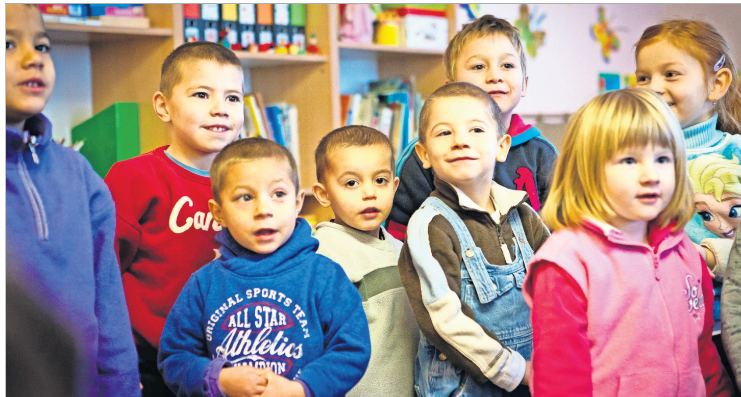
Es kommt häufiger vor, dass Menschen von hier ein Kleidungsstück wiedererkennen, das bei den Kindergartenkindern gute Dienste leistet.