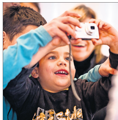
Die Technik der Besucher erregt Aufsehen.