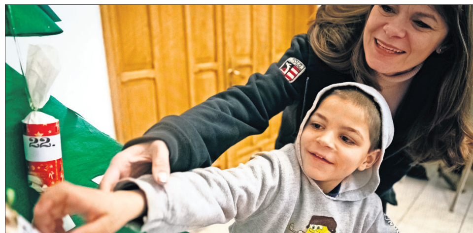
Jeden Tag öffnet ein anderes Kind ein Türchen des Adventskalenders.