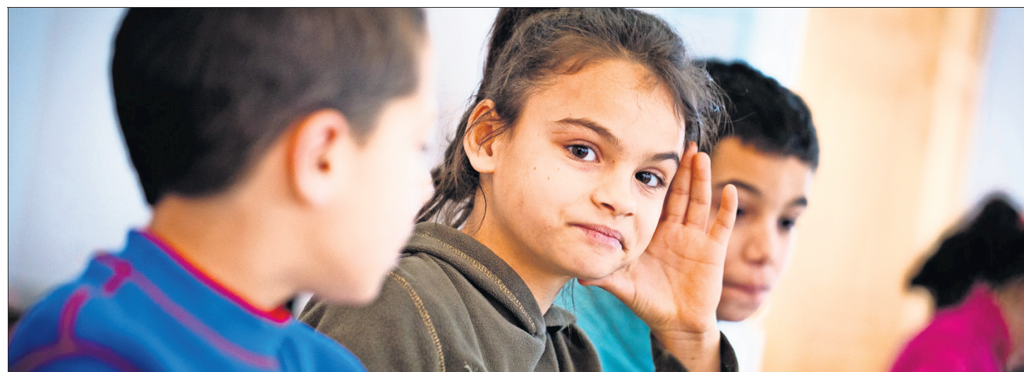
Wacher Blick: Beim Frühstück hat dieses Mädchen die Kamera stets im Blick. Die Aufnahmen auf dieser Seite sind während der Hilfsfahrt vom 18. bis 21. Dezember 2016 entstanden. Mehr als 2000 Weihnachtspäckchen hat der Förderverein in das 260-Seelen-Dorf gebracht.

Schulausstattung und Unterrichtsmaterialien verwendet werde. Der jüngste Hilfs-transport hat vor Weihnachten stattgefunden. Die Fotos auf dieser Seite legen Zeugnis davon ab, wie die Kinder in Zsobok von der Arbeit des Vereins profitieren.